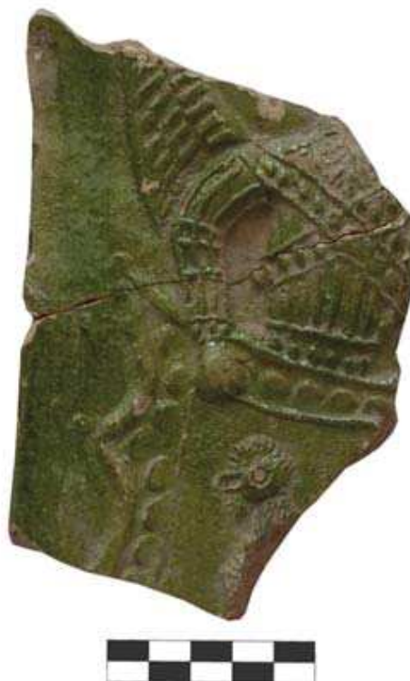
Obr. 7. Fragment kachlice s motivom Štítonosič, Oponický hrad.