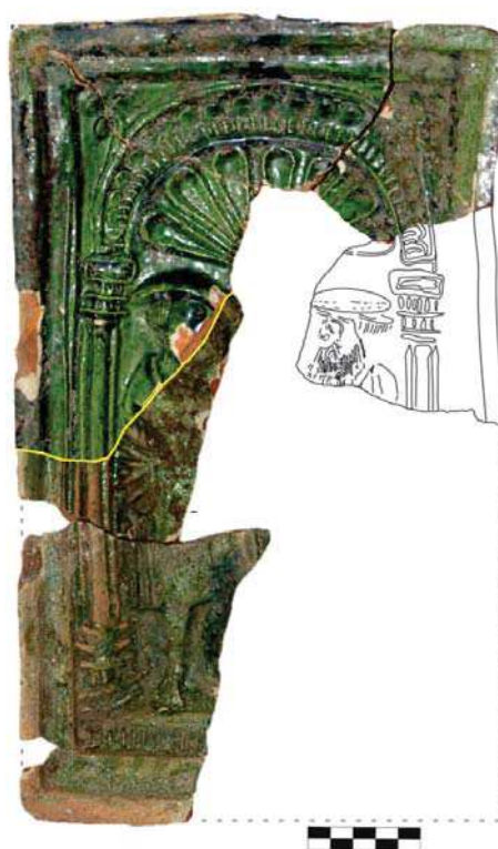
Obr. 6. Fragменты двух кachлиц с мотивом Двойца oпроти себе стоячих постáv, Oponický hrad.

Výjav štítonosiča sa objavuje už od obdobia gotiky, a to buď v podobe herolda alebo anjela ako ochrancu ( Mácelová/Kvietok 2013, 17 ). Na základe vyobrazeného erbu rozlišujeme mestské, rodové a zemské motívy ( Bielich 2010, 137 ). Podľa M. Bielicha (2010, 137) pochádza z územia Slovenska doposiaľ najväčší počet zlomkoch kachlíc s týmto motívom. Z obdobia 15. storočia sem patria napríklad nálezy z hradu Brekov ( Chovanec 2003, 13 ), Parič ( Chovanec 2003, 47 ), z Kláštoriska v obci Letanovce ( Egyházy-Jurovská/Fürýová 1993, obr. 40 ). Počas vlády Jagelovcov na prelome 15. a 16. storočia zaznamenávame vrchol mestskej heraldiky ( Kvietok/Mácelová 2013, 17 ). Výjav pretrváva aj v mladšom období 16. a 17. storočia, a to na nálezoch z hradu v Topoľčiankach ( Bielich 2010, evidenčné číslo 0364 ) a ďalších lokalít.