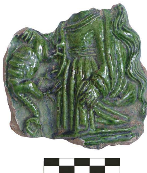
Obr. 9. Fragment kachlice s motívom Svätá Margaréta, Oponický hrad.

Vyobrazené prvky, ako stĺpy s klenbou a fialami, postava bez náznaku pohybu, nepomer medzi časťami tela, dlhý nariasený odev po zem či vypuklá tvár s očami, sú typické pre gotický umelecký štýl.