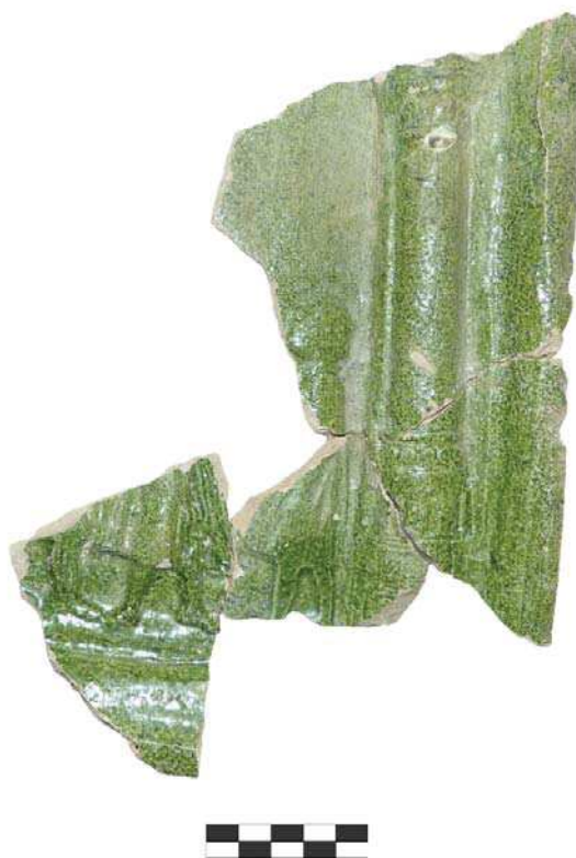
Obr. 5. Fragment kachlice s motívom Zostúpenie Ducha svätého, Oponický hrad.

Spojením oponických a topoľčianskych fragmentov kachlíc sa dá čiastočne rozpoznať odev postáv. Charakteristickým prvkom sú pančuchové nohavice, košeľovitý odev, končiaci približne v mieste kolien, a rovnako dlhý plášť. Vrchným mužským odevom boli od 14. storočia plášte, ktoré sa spínali vpredu sponou či gombíkmi, boli s rukávmi alebo bez nich, často sa dopĺňali kapucňou či kuklou. Dĺžka plášťa sa v priebehu času menila. Z pôvodne dlhého tvaru sa vyvinul renesančný plášť, ktorý siahal po lýtka alebo polovicu stehien, až po celkom krátku formu ( Zubercová 1988 , 49).