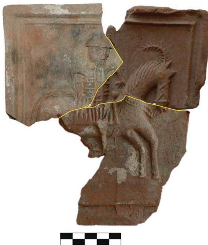
Obr. 4. Fragmenty troch kachlíc s motívom Jazdec na koni, Oponický hrad.

čistoty a Ducha svätého. Takýto motív sa objavuje v 16. storočí na kachliciach z hradu v Topoľčiankach (tab. I: 1; Ruttkay 2008 , 189, B 13) a v podobe fragmentu holubice na hrade Šintava ( Bielich 2010 , evidenčné číslo 0288). Klenba a stĺpy, ktoré tvoria orámovanie celého motívu, zaraďujú kachlice jednoznačne do obdobia renesancie.