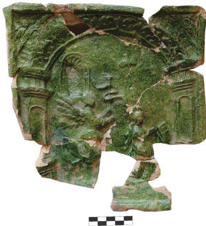
Obr. 8. Fragment kachlice s motívom Zvestovanie Panne Márii, Oponický hrad.