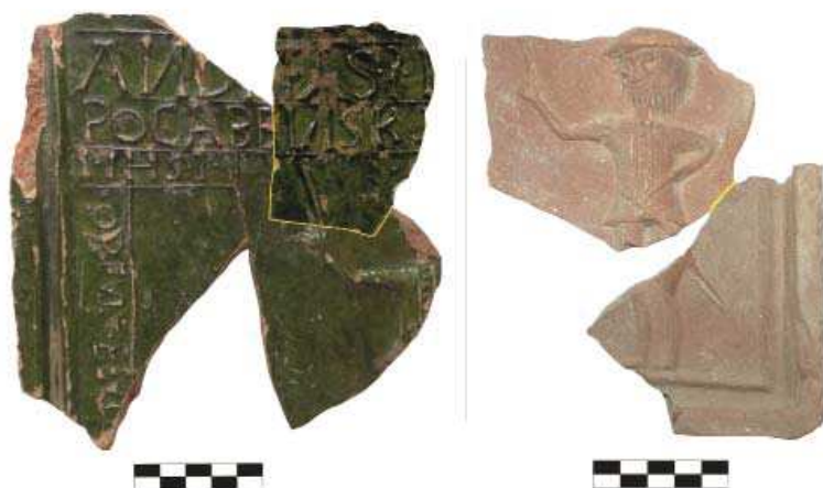
Obr. 3. Fragmenty štyroch kachlíc s motívom Postava ukazujúca na nápis, Oponický hrad.