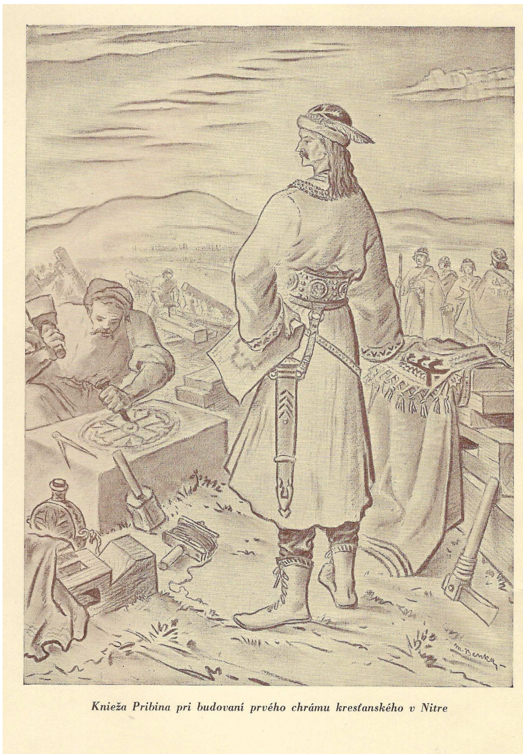
Knieža Pribina pri budovaní prvého chrámu kresťanského v Nitre