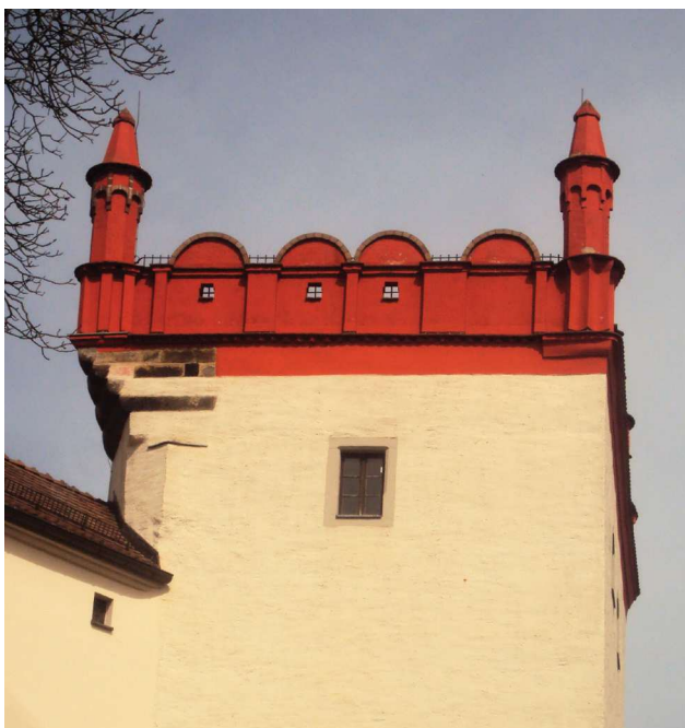
Obr. 13. Horní část Matyášovy věže hradu Ortenburgu v Budyšíňě (atika přistavěná kolem roku 1520).

se tedy říci, že se zde objevuje tento nový Šalomoun a „budoucí“ císař. Samotná obdélníková věž (Mathiasturm) v kontextu oslavování moci a vládce by mohla nést asociace s Davidovou věží v Jeruzalémě. Jihozápadní roh věže v její horní zóně má diagonální řez a těsně nad ním tříступňové kamenné odsazení, jakoby podstavec pro nějaký ztracený prvek (obr. 13). To naznačuje, že se zde mohla nacházet věžička podobná té známé z Davidovy věže v Jeruzalémě (tzv. minaret). Její výstavba se však nejčastěji připisuje době Sulejmana Velkolepého, nebo dokonce letům 1635–1655. 62 Existují však důvody domnívat se, že tento minaret měl svého předchůdce. Naznačuje to pozdně středověká