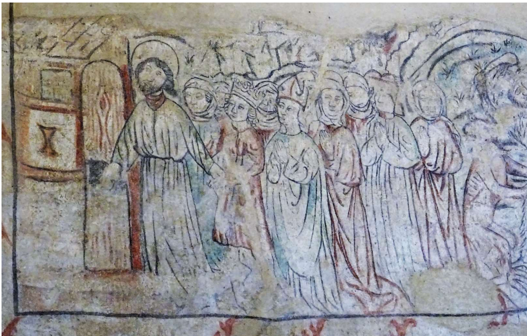
Obr. 2. a 3. Fragment výjevu Posledního soudu v kostele sv. Ducha v Krnově s obrazem zatracených a spasených s králem Matyášem Korvínem v čele družiny.

molen, vnd einen könig vff eynir tragen trugen czwen tewffil in die helle. Do wir das dem apte lissen wissen, von statan in derselben nacht lisse er den könig awsleschen, vff das jm nicht seine dörffere wurden abgebrant warden [vyzn. B. C.] 26 Ve Vratislavi opat rezignoval, ale v Krnově, jak je vidět, se propaganda proti kacírskému králi rozvíjela bez jakýchkoli