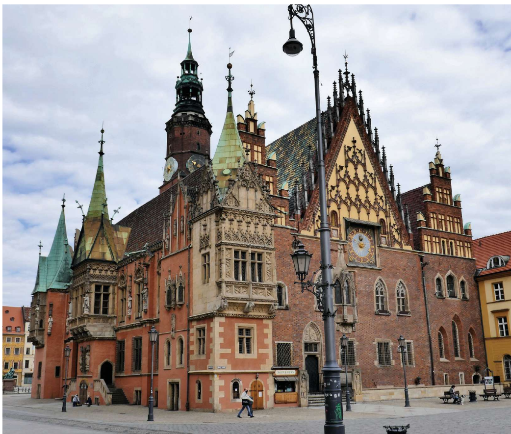
Obr. 4. Radnice ve Vratislavi z jihovýchodu.

Od roku 1408 spravovala krnovský špitál sv. Ducha městská rada, což potvrzuje i načiní měšťanů namalované pod vítězným obloukem kostela ve druhé polovině 15. století. Pastorační péči mohli zajišťovat místní minorité – kněz, který na malbě vede krále Matyáše, má na sobě spíše minoritský hábit, a nikoli například plášť člena řádu německých rytířů, který měl patronátní právo nad místním farním kostelem a byl špitálským řádem par excellence . Za zmínku stojí, že když zde Matyáš převzal moc, Krnov se de facto stal královským městem, což mohlo také motivovat měšťany k tomu, aby se postavili