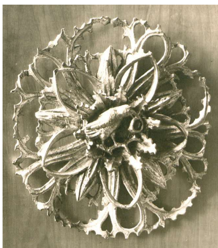
Obr. 6. Rozeta ze stropu středního arkýře jižního průčelí radnice ve Vratislavi, z období kolem roku 1485, ztracená v roce 1945, s rodovým znakem krále Matyáše. Fotografie před rokem 1945. Biblioteka Uniwersytecka we Wrocławiu, Oddział Zbiorów Graficznych, inv. č. 2991/100.