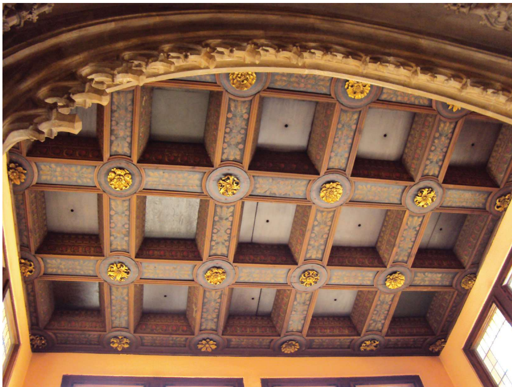
Obr. 5. Strop středního arkýře jižní fasády radnice ve Vratislavi.