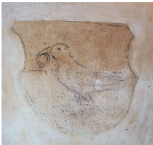
Obr. 11. Štít s osobním znakem Matyáše Korvína v síni domu č. 45 ve Slavonicích.