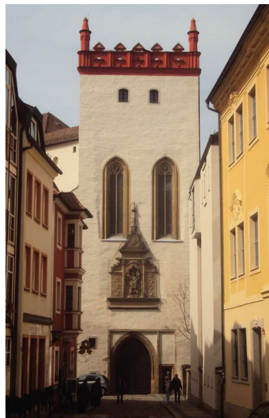
Obr. 9. Matyášova věž hradu Ortenburgu v Budišíně.

Tento charakter mohl mít i erb vládce na dolnoslezském hradu Grodziec, který nechal postavit Fridrich I., vévoda lehnicko-břežský. Pochybuji však, že by tento manžel jedné z dcer krále Jiřího z Poděbrad chtěl projevit svou věrnost Hunyadimu na jednom ze svých hradů. 48 Na druhou stranu Matyáš legitimoval jeho nejistá práva v Břehu (pol. Brzeg), který si nárokovali bývalí zástavní věřitelé města a knížectví – opolští vévodové. Je však možné, že tento erb pochází z doby rozsáhlého rozšíření hradu, které provedl syn Fridricha I., Fridrich II., ve 20. a 30. letech 16. století. Matyáš byl v té době již dávno pryč, ale v paměti setrval jako neochvějný obránce Evropy a křesťanství proti Turkům. Turecká, respektive jeruzalémská témata jsou silně přítomna v mecenášství