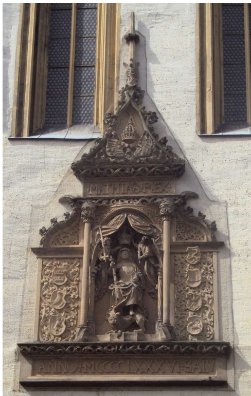
Obr. 8. Pomník Matěje Korvína na průčelí Matyášovy věže hradu Ortenburgu v Budyšíně.

hypoteticky mohlo být jiné: že Matyáš chtěl zdůraznit nějaká dědičná práva k těmto dvěma zemím. Tento předpoklad, vycházející z analýzy uměleckého díla, není podpořen diplomatickým ani epistolárním materiálem. Ponechejme jej tedy zde na papíře jako možnou stopu pro takový výzkum. Prozatím se zaměříme na další analýzu sochařského díla.