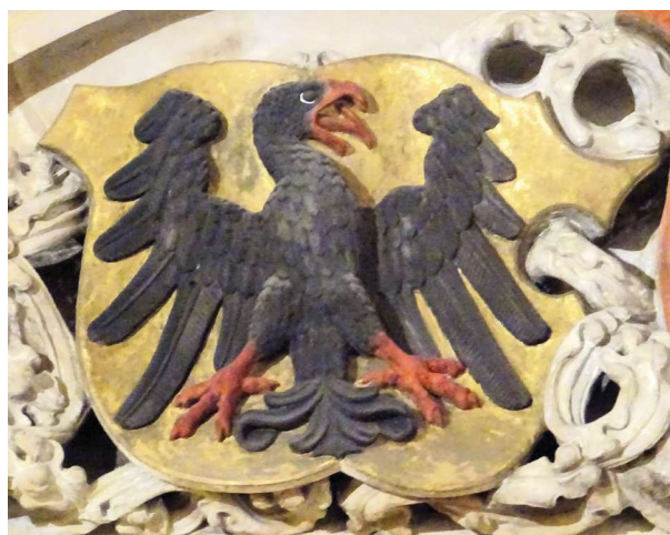
Obr. 7. Fragment tympanonu z velkého sálu do kaple na radnici ve Vratislavi.