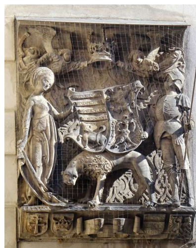
Obr. 10. Erb Matyáše Korvína na průčelí radnice ve Zhořelci.