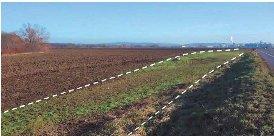
Obr. 2. Torzo historickej cesty (ozn. prerušovanou čiarou) v krajine Dudvážskej mokrade.

(cca 9,5 a 7,6 m), výška 2 ½ až 3 viedenské stopy, čiže 79 cm až 1 m. 91 Hlinu na ich budovanie kopali robotníci pozdĺž okrajov hradskej. Teleso historickej cesty zahradila rekultivácia po dokončení novej komunikácie II/513. 92 Zvyšky pôvodnej hradskej však možno v miestnej krajine identifikovať dodnes (obr. 2).