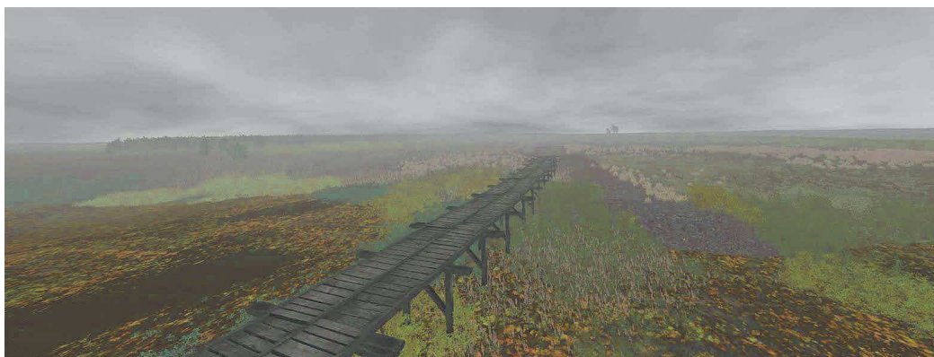
Obr. 3. Vizualizácia mosta bez zábradlia. Autor: D. BEŠINA (2020).

Opravovaný úsek cesty lemovala poľná komunikácia. Používali ju v suchých (suchších) obdobiach roka, kedy boli bočné korytá (Hor.) Dudváhu bez vody. Stály vodný tok sa nachádzal iba na východnom okraji Dudvážskej mokrade, kde ho preklenoval most bez zábradlia (!) pri leopoldovskom mýte s krčmou a voziarňou. V daždivom počasí alebo počas záplav Dudvážskej mokrade vodami Váhu a (Hor.) Dudváhu sa preprava osôb a tovarov presunula na hradskú na násypoch s mostami, ktoré chránilo „ šesť závor s dvoma kolmi a jedným brvom krížom upevneným, aby bola cesta na násype prehradená, keď vozy môžu pokračovať cez susedné [poľné] cesty “. 109