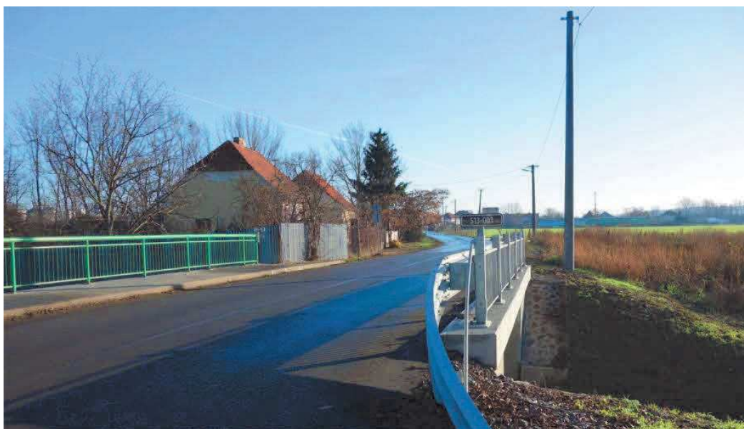
Obr. 4. Trnavská cesta v Leopoldove. Na ploche porastenej náletom (za mostom vpravo) stál kedysi objekt leopoldovského mýta (tzv. Vartovka). Foto: P. CHRASTINA (XII/2019).

Trnavská cesta, miestna komunikácia v Leopoldove, predstavuje na začiatku druhej dekády 21. storočia jediný zachovaný úsek Mikovíniho cesty. Slúži ako príjazdová komunikácia k priemyselnému areálu (obr. 4).