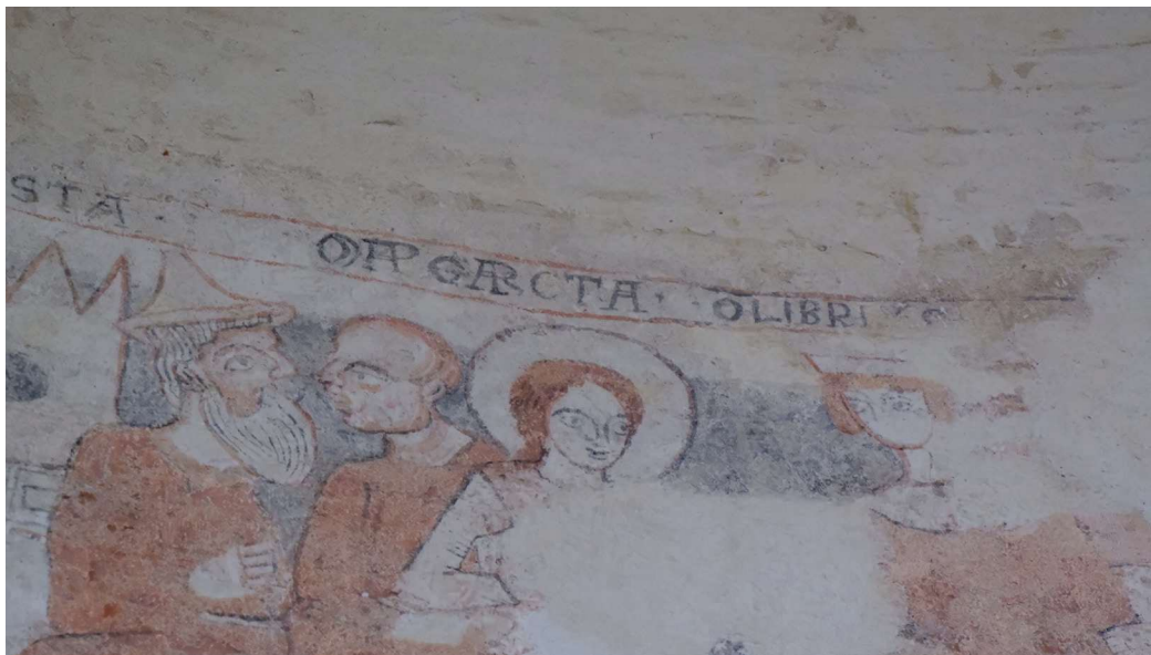
Obr. 1. Ranogotická majuskula na nástennej malbe v Šiveticiach (3. tretina 13. storočia).