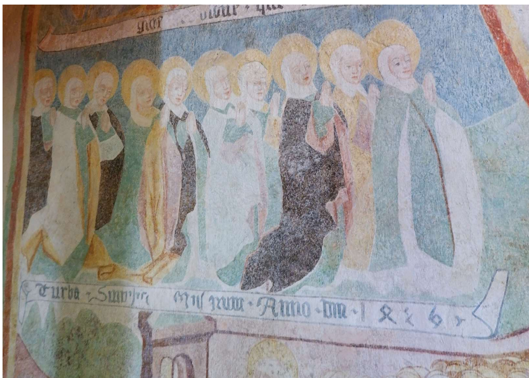
Obr. 3. Gotická minuskula a jej nedokonalé reštaurovanie na nástennej malbe v Kyjaticiach (1446).