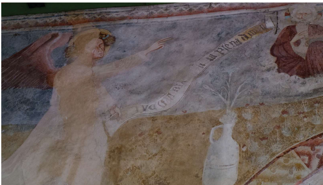
Obr. 2. Vrcholnogotická majuskula a gotická minuskula na nástennej malbe v Kraskove (2. polovica 14. storočia). Foto: autorka, 2023.

ktoré časti písmen sú ozdobne zdvojené, napr. brvno litier A , drieky litier V či dokonca uzavretie oblúčika v literách C a E . Litera U má ešte tvar písmena V a oba drieky sú v hornej časti spojené, no M oblúčiky v dolnej časti spojené nemá (aspoň podľa súčasného dochovania). Písmená majú ozdobné serify a v niektorých prípadoch aj trne (napr. na zakončeníach písmena I , R , S ). Litera R má zároveň zahnuté rameno a litera I nodus v strede drieku. Financovanie výmalby kraskovského kostola možno prisúdiť tunajším zemepánom, ktorými v druhej polovici 14. storočia boli páni zo Sečian – Mikuláš, zvaný Koňa a jeho syn Frank zo Sečian. 41 Malby realizovala dielňa s výraznou orientáciou na talianske trecento, podľa M. Tognera to bol tzv. Majster kraskovských malieb a jeho pomocník. 42