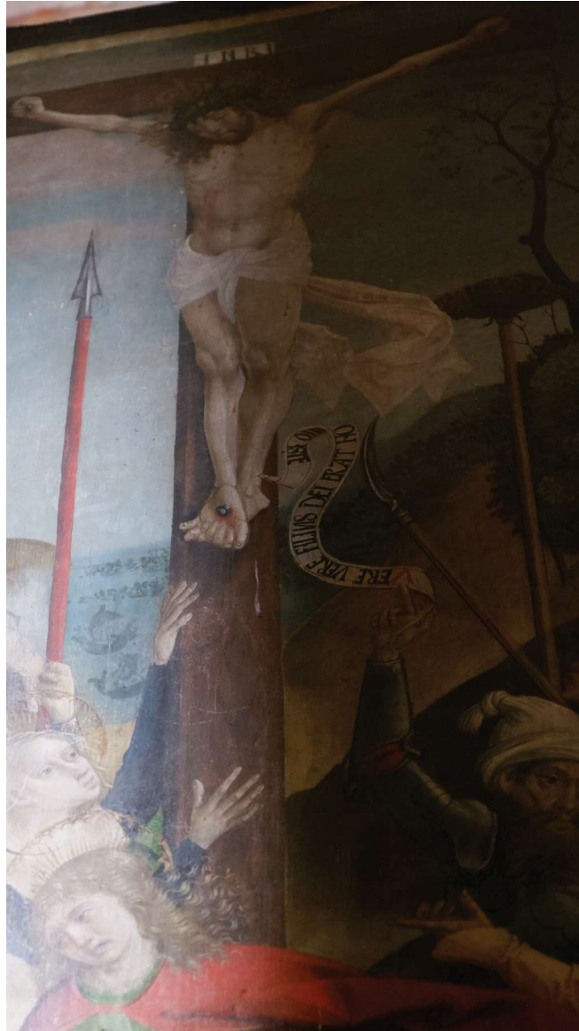
Obr. 5. Ranohumanistická kapitála na oltárnej tabuli s malbou Ukrižovania v Chyžnom (1508).

Neskorogotický oltár v Chyžnom vznikol v dielni Majstra Pavla z Levoče na objednávku rodu Zápoľských, ktorí Chyžné ako súčasť jelšavského panstva vlastnili od poslednej tretiny 15. storočia (podobne ako Revúcu, ktorú sme zmienili vyššie). Z opačnej strany severného oltárneho krídla je malba