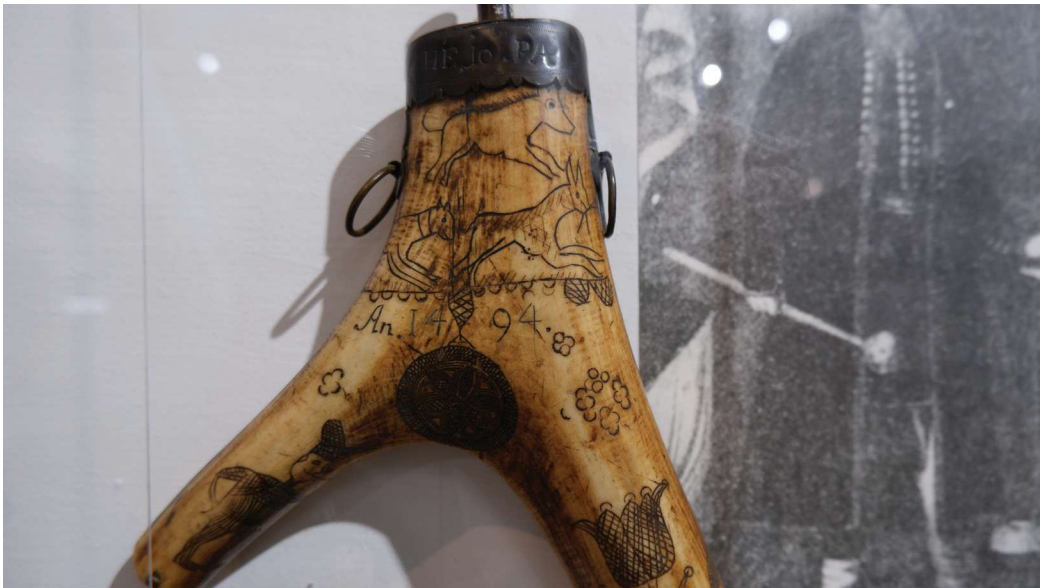
Obr. 6. Novoveká kapitála a arabské číslice na prachovnici (1494?).

tzv. enkláva pri vpísaní písmena E do oblúčika litery P (charakteristický znak novovekej kapitály). 95