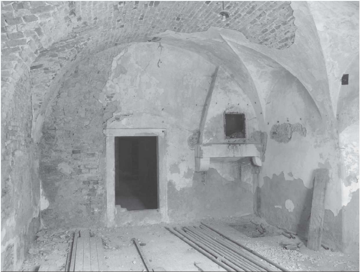
Obr. 4. Miestnosť 1.11 v severozápadnom nároží kaštieľa s renesančným kozubom datovaným do roku 1578. Autor: Miroslav Matejka.

miestnosti mali výsečové klenby so styčnými lunetami a dva priestory výsečové klenby. Identicky s miestnosťami v južnom trakte mali priestory severného traktu v úrovni nábehov klenieb v severnej stene ústupky okrem dvoch miestností s odlišne konštruovanými klenbami.