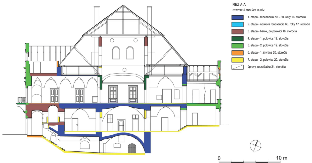
Obr. 8. Rez A-A kaštieľom - slohová analýza. Autor: Miroslav Matejka.

Najneskôr v čase tretej stavebnej fázy v súvislosti s úpravou fasád zbúrali záchodový rizalit vo východnej časti severnej fasády. Vstupný vežový rizalit rozšírili západným smerom a zriadili v ňom kamenné schodisko. Prestavba si vyžiadala úpravu časti klenby vstupného priestoru na druhom nadzemnom podlaží. Severozápadné nárožie spevnil zošíkmený pilier. Fasády dostali sivý náter. Ďalšie prípadné detaily úpravy fasád sa vzhľadom na torzovité zachovanie nedaľo identifikovať. Do vzhľadu „horného kaštieľa“ zasiahla prestavba strechy v roku 1758. Zrejme vtedy v podkroví vybudovali medzitraktové nosné múry manzardovej strechy členené oblúkmi. Súčasne s nimi vznikli na západnej a východnej fasáde tehlové štíty, ktoré pod korunou členili dve kruhové okná. Po úprave strecha nadobudla vzhľad blížiaci sa dnešnému stavu, t. j. manzardová strecha s polvalbovým ukončením na západnej a východnej strane. Sklon strechy bol oproti dnešnému stavu menší.