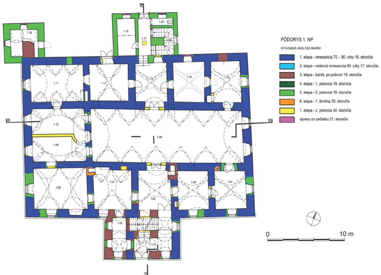
Obr. 5. Pôdorys kaštieľa v úrovni 1. NP - slohová analýza.