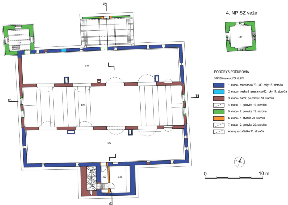
Obr. 7. Pôdorys kaštieľa v úrovni podkrovia, 3. NP a 4. NP severozápadnej veže - slohová analýza. Autor: Miroslav Matejka.