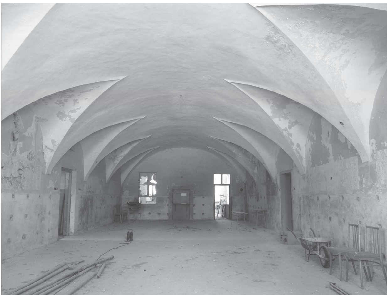
Obr. 3. Pohľad od východu do centrálnej miestnosti 1.08 s renesančnou výsečovou klenbou.

Vchod do prvého nadzemného podlažia viedol portálom v južnej stene rizalitu. Podľa vyobrazenia z roku 1752 sa nad portálom vypínala nápisová doska, ktorá ale mohla byť výsledkom mladších prestavieb. Z rizalitu sa vchádzalo