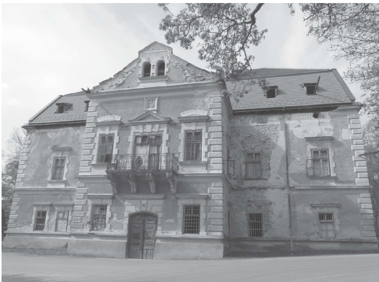
Obr. 1. Pohľad na južné priečelie kaštieľa. Na východnej strane je viditeľná renesančná výzdoba fasády z 2. stavebnej etapy.