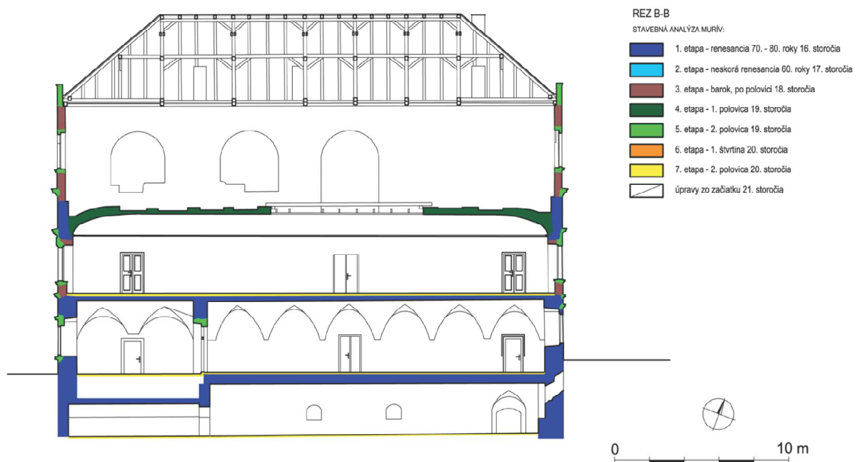
Obr. 9. Rez B-B kaštieľom - slohová analýza.