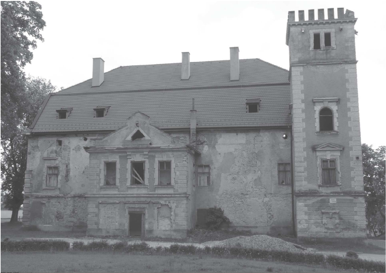
Obr. 10. Pohľad na kaštieľ od severu. Po stranách rizalitu vidno zamurované vstupy do prevetov z 2. stavebnej etapy. Autor: Miroslav Matejka.

Dvere v úrovni prvého nadzemného podlažia získali obložkové zárubne s jednoduchou profiláciou a kazetové dverné krídla. V stene oddeľujúcej sálu od miestnosti v západnej časti stredového traktu vybudovali nové dvere s nadsvetlíkom a v južnej časti steny okno umožňujúce osvetlenie sály od západu. Dvere v úrovni druhého nadzemného podlažia dostali kazetované dvojkridlové výplne a obložkové zárubne členené kazetami. Úpravy zasiahli aj strechy, kde nadstavali západný a východný štít, v ktorých vznikli vysoké okná s polkruhovými záklenkami. Zároveň barokovú konštrukciu krovu nahradili novou. Schodisko v južnom rizalite nadobudlo súčasnú podobu s dreveným obkladom stupňov.