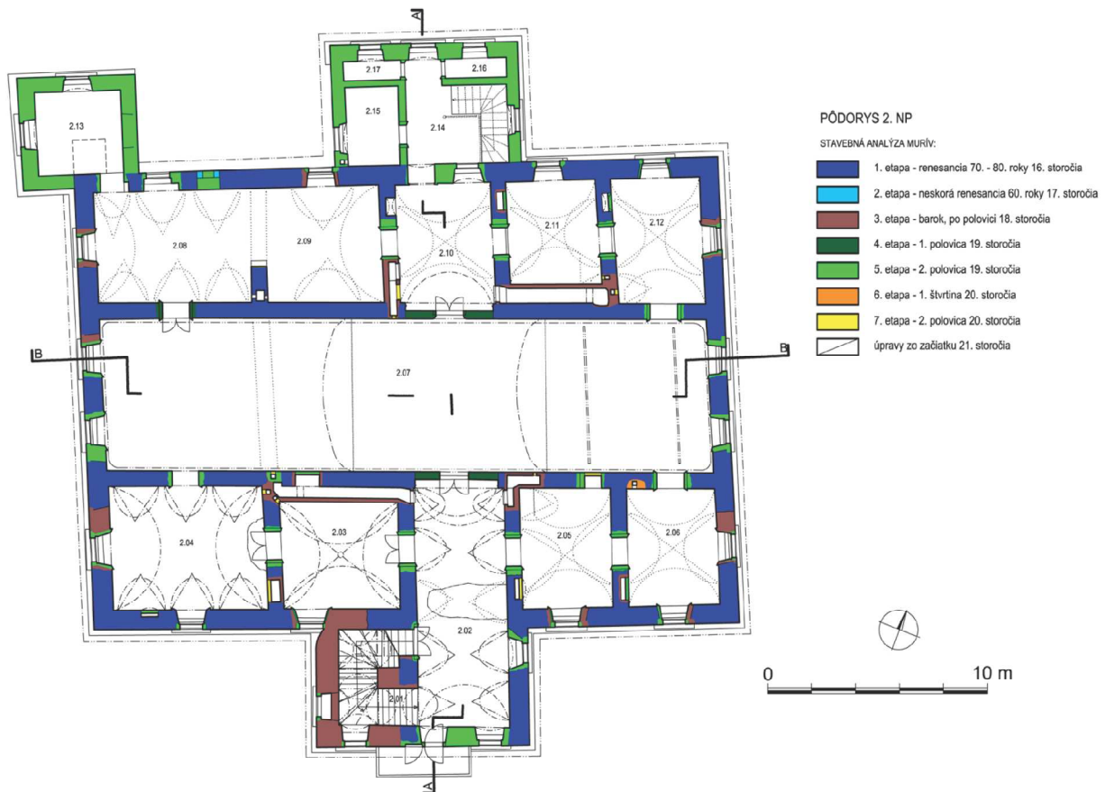
Obr. 6. Pôdorys kaštieľa v úrovni 2. NP - slohová analýza.