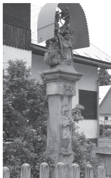
Obr. 27. Stĺp s Korunováciou Panny Márie Sv. Trojicou v Sedliackej Dubovej.