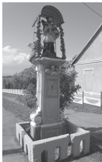
Obr. 15. Stĺp sv. Jána Nepomuckého v Chyžňom.