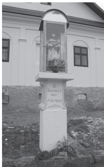
Obr. 17. Stĺp sv. Jána Nepomuckého v Kline.