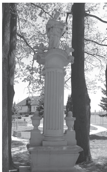
Obr. 16. Stĺp sv. Jána Nepomuckého v Bobrove.

Pôvodne pomerne jednotná kompozičná skladba prícestných stĺpov a určitý zmysel pre poriadok a jednoduchosť sa nám čoraz viac rozpadajú do viacerých formálnych konceptov. V Suchej Hore sa niekedy v druhej polovici 18. storočia objavil nový tvar drieku, ktorý kombinuje kvadratický prvok so stĺpom s hlavicou. Stĺp postavili pri kostole a na jeho vysokom sokli sa nachádza reliéf sv. Jozefa s Dieťaťom. Bobrov sa stal vďaka rozvoju plátenníctva významným oblastným centrom a v roku 1818 mestečkom. 27 Plátenníci s obľubou budovali svoje objekty špecifickým architektonickým štýlom, v ktorom nachádzame mnoho klasicistických vzorov. Presnejšie nedatovaný stĺp so sv. Jánom Nepomuckým vznikol v Bobrove na tunajšom