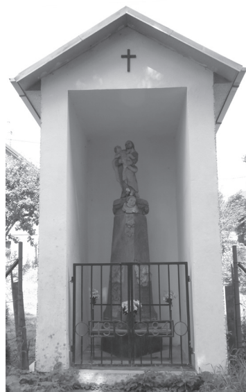
Obr. 22. Stĺp so sv. Jozefom v Rabčiciach.