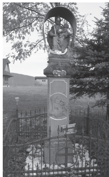
Obr. 21. Stĺp s Pannou Máriou s Dieťaťom v Oravskej Lesnej.