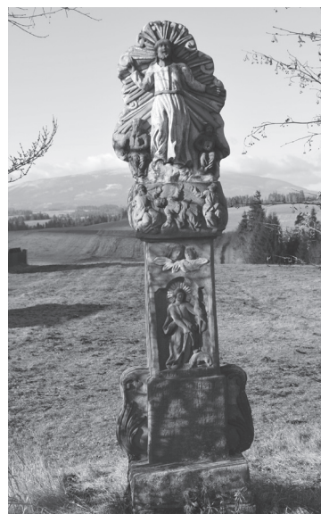
Obr. 13. Stĺp s Premenením Pána na hore Tábor v Jablonke.