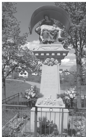
Obr. 19. Stĺp s Pietou v Bobrove.