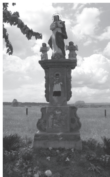
Obr. 8. Stĺp s Immaculátou v Chyžnom.