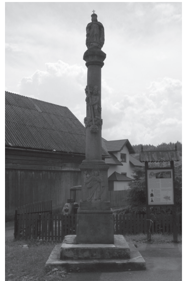
Obr. 11. Stĺp s Pannou Máriou, Kráľovnou nebies, v D. Lipnici.