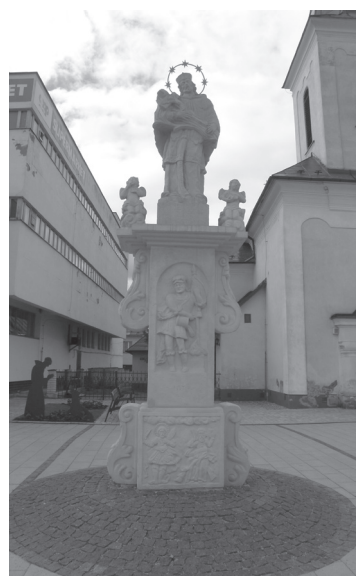
Obr. 5. Stĺp sv. Jána Nepomuckého v Trstenej.