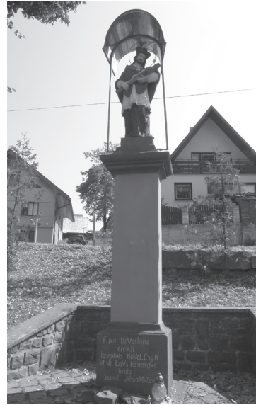
Obr. 24. Stĺp sv. Jána Nepomuckého v Zubrohlave.