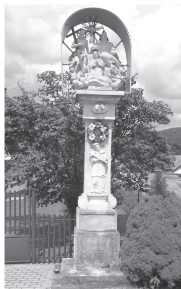
Obr. 26. Stĺp s Korunováciou Panny Márie Sv. Trojicou v Hornej Lehote.