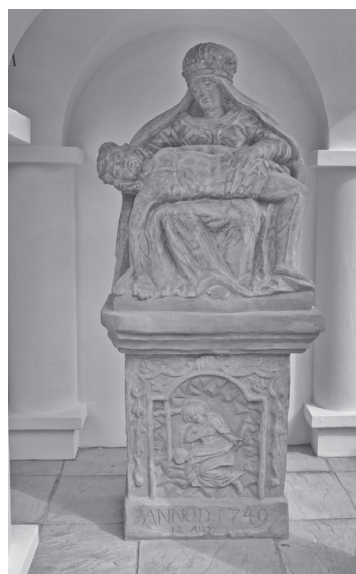
Obr. 6. Stĺp s Pietou v Tvrdošíne.

Významný mariánsky ikonografický program spodobuje Nepoškvrnenú Panu Máriu, tzv. Immaculatu. Madona v tejto podobe stojí na zemeguli alebo kosáku mesiaca, nohami pristupuje hada. Okolo jej hlavy býva zobrazených 12 hviezd. 19 Najstarším dokladom Immaculaty z Oravy je prícestný stĺp z Oravskej Jasenice datovaný do roku 1753.