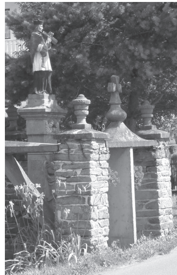
Obr. 25. Stĺp sv. Jána Nepomuckého v Podsrní.