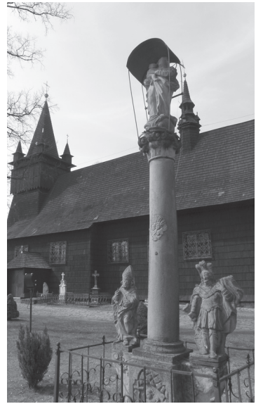
Obr. 10. Stĺp s Pannou Máriou s Dieťaťom v Orávke.

Najstarší stĺp so sv. Floriánom z Trstenej z roku 1705, ktorý sem ikonograficky patrí, sme už spomínali vyššie. Sv. Florián je patrónom hasičov a ochrancom pred požiarom, ktorý bol v oblasti Oravy veľkým nebezpečenstvom. 22 Ďalší stĺp zasvätený tomuto svätcovi pochádza z obdobia druhej polovice 18. storočia a nachádza sa v Hladovke pred kostolom. Presnejšie datovanie nepoznáme, avšak už skôr bola konštatovaná jeho štýlová podobnosť so stĺpom sv. Jána Nepomuckého z Ústia, ktorý je