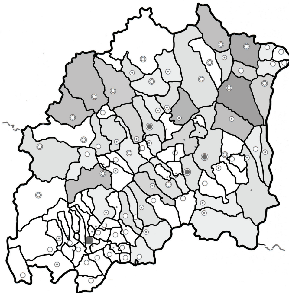
Obr. 2. Mapa početnosti výskytu prícestných stĺpov na Orave. Sýtosť sivej od najnižšej (počet 1) až po najvyššiu (počet 8) určuje množstvo stĺpov v chotároch jednotlivých obcí.

tickej potreby, akými boli napríklad osly, bahríky na stavbu pecí, brúsne kamene a ďalší tovar. Onedlho sa však prejavilo umelecké cítenie a schopnosť opracovať kamenný materiál na náročnejšie predmety.