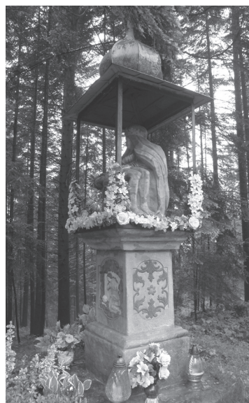
Obr. 7. Stĺp s Pietou na Danielkách v Podolku.