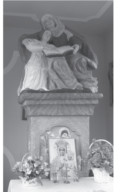
Obr. 3. Stĺp sv. Anny v Podvlku.