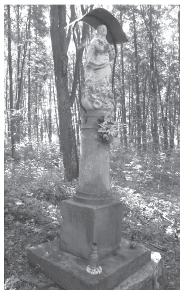
Obr. 28. Stĺp s Immaculatou v Osade.