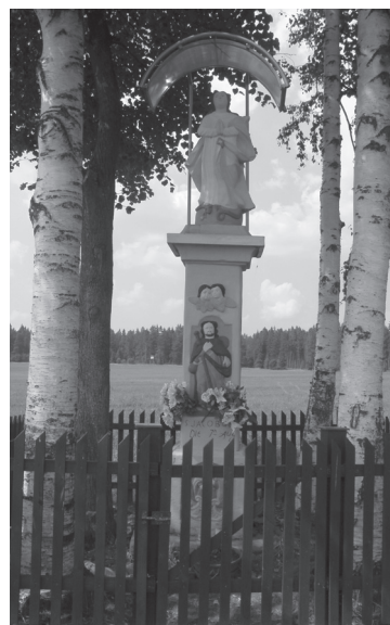
Obr. 9. Stĺp s Immaculátou v Bobrove pri hranici s D. Lipnicou.