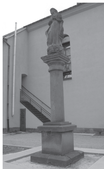
Obr. 20. Stĺp s Immaculatou v Tvrdošíne.

Jednou z najzložitejších kompozícií sochársky stvárňovaných v korunách stĺpov je téma Korunovania Panny Márie Sv. Trojicou. Táto téma bola mimoriadne obľúbená v barokovom umení a často sa nachádzala vo vrcholoch oltárnych architektúr (naprí-