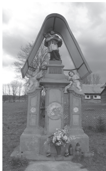
Obr. 14. Stĺp sv. Jána Nepomuckého v Podvolku.