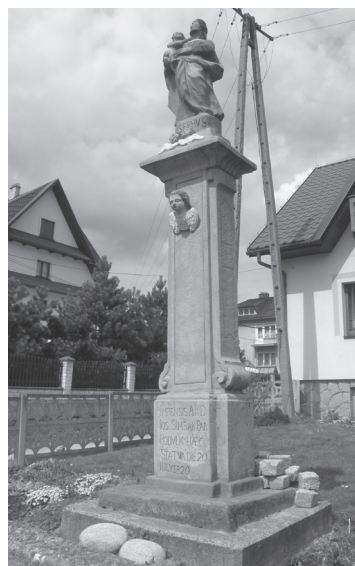
Obr. 23. Stĺp so sv. Jozefom v Podvlku.