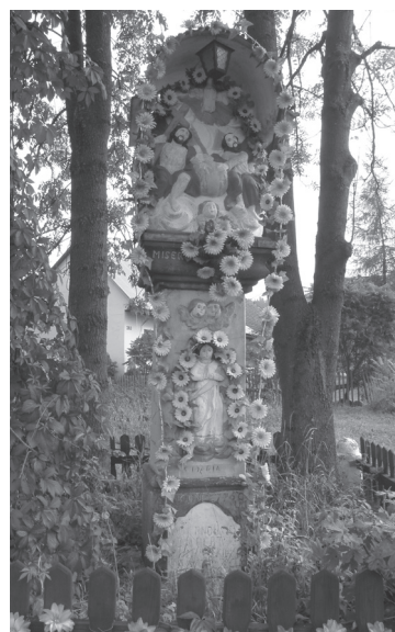
Obr. 12. Stĺp so Sv. Trojicou v Dolnej Zubrici.