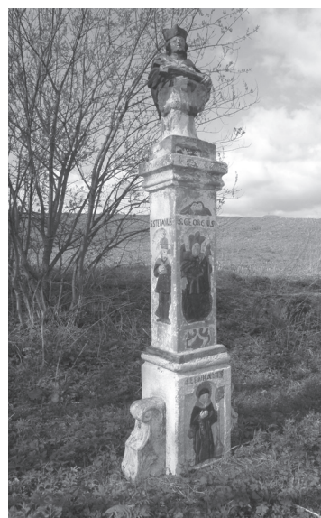
Obr. 4. Stĺp sv. Jána Nepomuckého v Ústí nad Oravou.