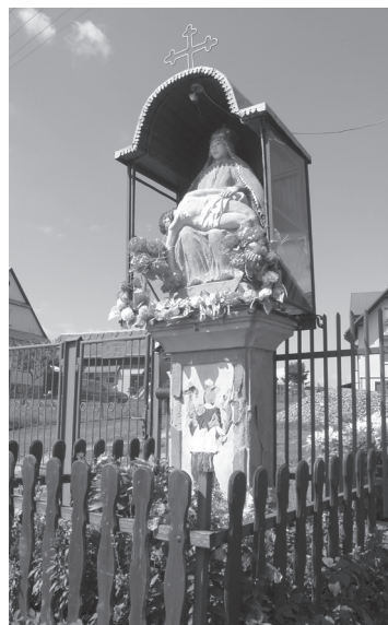
Obr. 18. Stĺp s Pietou v Pekelníku.