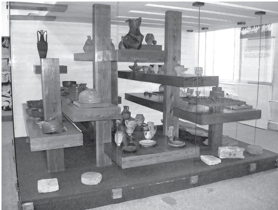
Obr. 3. Pohľad na vitrínu s nálezmi z doby rímskej.

Ďalšia výstavná miestnosť, druhá najväčšia (1080 x 860 cm), je venovaná príchodu Rimanov na naše územie, resp. rímskym pamiatkam v okrese Komárno, ako aj vplyvu na toto územie. Je však iróniou, že veľká väčšina vystavených predmetov nepochádza zo súčasného územia Komárňanského okresu, ale z južnej, zadunajskej časti bývalej Komárňanskej župy, ktorej územie bolo súčasťou Rímskej ríše. Väčšina predmetov pochádza z rímskeho tábora v Ószónyi-Brigetiú alebo z neurčiteľného miesta, 25 ale mnohé sú aj z ižianskeho Leányváru. 26 O mnohé