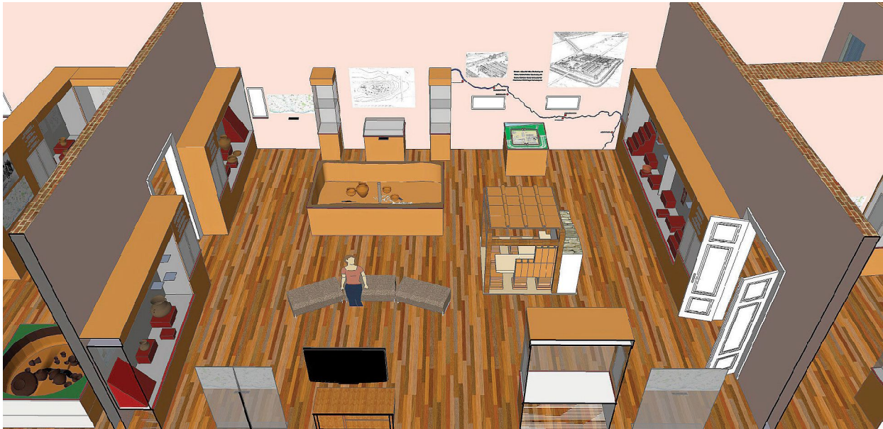
Obr. 7. Virtuálny návrh druhej miestnosti novej expozície (autor Andrej Ozimy).

V poradí druhá miestnosť je o niečo menšia ako predchádzajúca a má mierne kosoštvorcový pôdorys s rozmermi 10,8 x 8,6 m a plochu 93 m 2 . Aj do tejto miestnosti prichádza prirodzené svetlo cez tri okná na východnej stene. Je tu vchod do tretej miestnosti. Táto časť expozície bude zahŕňať štyri stanoviská, a to Osídlenie v staršej dobe železnej , Osídlenie v mladšej dobe železnej , Osídlenie v dobe rímskej a v období sťahovania národov . Bude tu aj miesto na posedenie či sledovanie krátko filmového dokumentu, resp. usporiadanie tematických prednášok pre školské skupiny.