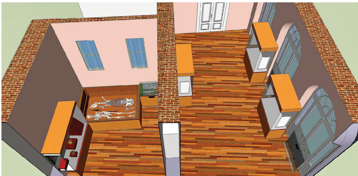
Obr. 8. Virtuálny návrh tretej a štvrtej miestnosti novej expozície (autor Andrej Ozimy).

Následne sa návštevník presunie do tretej miestnosti, ktorá je výrazne menšia ako predchádzajúce dve. V nej sa zároveň nachádza vchod do štvrtej miestnosti, ako aj únikový východ na chodbu múzea a vstup do historickej expozície. Pravá stena je riešená formou troch zasklených oblúkov, z ktorých tretí plní funkciu vstupu z chodby. Naľavo od vstupu do historickej expozície je okno, ktoré sa v budúcnosti plánuje prebudovať na vchod výťahu. Rozmery tejto miestnosti sú 4,3 x 8,3 x 4 x 8 m a plocha 34 m 2 . Štvrtá, najmenšia miestnosť expozície, bude vytvorená prebudovaním súčasných toaliet. Ide síce o malú miestnosť s rozmer-