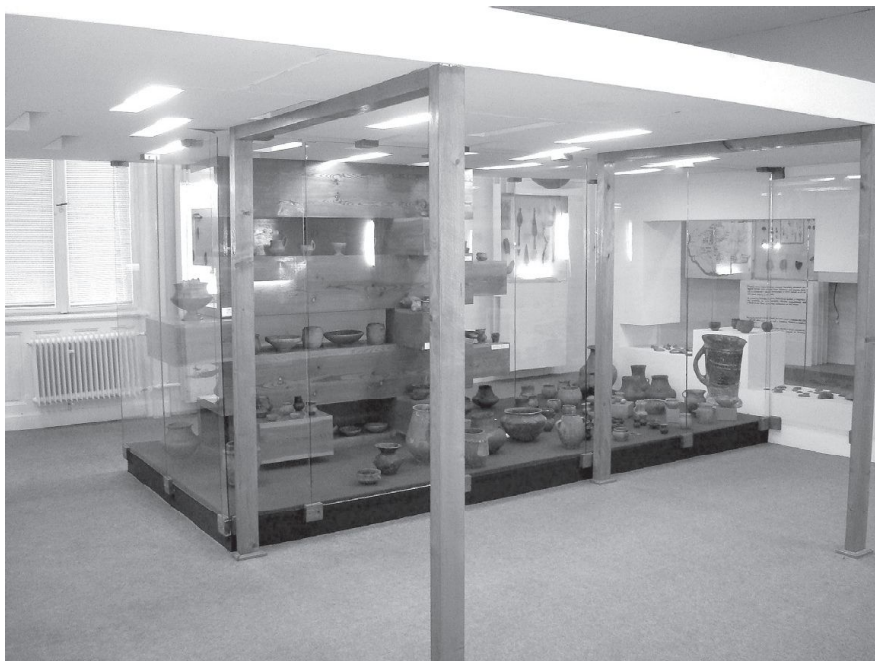
Obr. 2. Pohľad na časť vitríny s pravekými nálezmi.