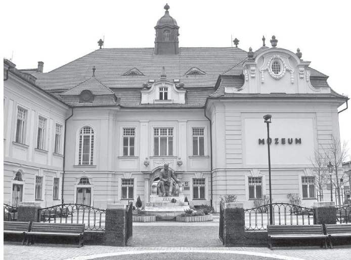
Obr. 1. Kultúrny palác - hlavná budova Podunajského múzea z r. 1913.