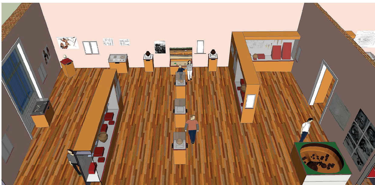
Obr. 6. Virtuálny návrh prvej miestnosti novej expozície (autor Andrej Ozimy).

Prvá miestnosť je zo všetkých najväčšia a má mierne lichobežníkovitý pôdorys s rozmermi 14,1 x 9,3 x 10,2 + 3,3 x 8,6 m a plochu 123 m 2 . Jej štyri okná poskytujú dostatok prirodzeného svetla.