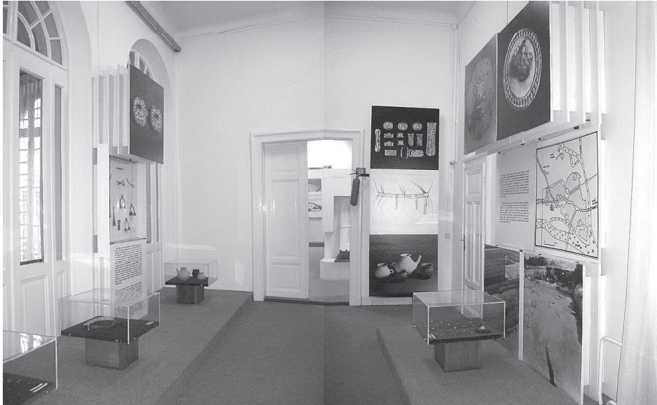
Obr. 4. Pohľad na miestnosť s nálezmi z obdobia Avarského kaganátu.

Táto miestnosť je zo všetkých najmenšia (750 x 420 cm), je tu inštalovaných najmenej predmetov a tvorí prechod medzi archeologickou a historickou expozíciou, t. j. zachytáva obdobie medzi dobou rímskou a včasným stredovekom.