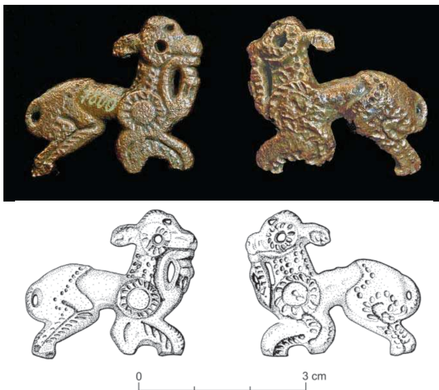
Obr. 1. Preseľany nad Ipľom. Zvieracia plastika. kresba: D. Zeleňáková

vyobrazenia okrídlených levov a podobných hybridných kreatúr držiacich v tlame najčastejšie ľudskú alebo zvieraciu končatinu (Frey 1969, tab. 27: 36; 1981, obr. 8-10). Zvieratá i končatiny v ich tlamách sú podané realisticky, vyhotovené rytou, tepanou alebo kombinovanou technikou. Motív šelmy s končatinou v tlame sa objavuje aj v tráckom umení, hoci podstatne zriedkavejšie ako na situlách (Alexandrescu 1984, obr. 3: 2; Frey 1981, obr. 11). Jediným trojrozmerným predmetom je masívnejšia ozdoba zo zliatiny olova a cínu v tvare vírivého ornamentu s rozoznateľnou ľudskou nohou v tlame jednej zo štyroch zvieracích hláv, z bohatého hrobu 38 v mohyle II z Magdalenskej gory, ktorú podrobnejšie zhodnotil O.-H. Frey (1981, obr. 2: 1; 4: 12). Predmety tohto typu, spolu s ďalšími nálezmi z Magalenskej gory, Doljenske Toplice i zo Stičny (Kromer 1986, obr. 54: 3-6) sú v tomto prostredí ojedinelé. O.-H. Frey (1981, 233) naznačil, že priame paralely k vírivým ozdobám v etrusko-venetskej oblasti chýbajú a ani v „skýtskom“ prostredí veckerzugskej kultúry, s ktorými juhovýchodolapská oblasť má v 5. storočí pred Kr. úzke kontakty, ani z oblastí ďalej na východ nie sú ozdoby tohto typu nateraz doložené, pričom trácko-gétske paralely z okruhu tzv. strieborného depotu z Craiovy sú podstatne mladšie (4. stor. pred Kr.). Napriek absencii súvekých nálezov v stepnej oblasti zdôraznil K. Kromer (1986, 58) východný pôvod vírivého ornamentu.