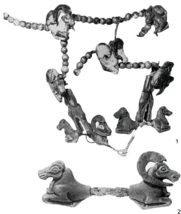
Obr. 5. Pazyryk, mohyla 3 (podľa Rudenko 1953, tab. 51)

Napriek naznačeným súvislostiam nemá zvieracia figúrka z Preselian nad Ipľom priame paralely. Pokiaľ by bol predpoklad, že ide o súčasť nákončia alebo hrkálky s realisticky vymodelovaným zvieratkom správny, potom by náš nález mohol pochádzať z hrkálok starších typov s prelamovaným dvojkónickým telom, datovaných do 6. až 5. stor. pred Kr., medzi ktorými však plastika zvieratka s bradou zatiaľ chýba. V súvislosti s nálezom z Preselian nad Ipľom treba poukázať ešte na jeden výrazný znak, na plastický kotúč s radiálnymi ryhami na pleci a hlave figúrky. Na predmetoch zhotovených v skýtskom zvernom štýle sa tento motív spravidla nevyskytuje. Zastúpený je najmä na ozdobách s vírivým ornamentom, či na zvýraznených detailoch zoo- či antropomorfných vyobrazení v trácko-gétskom prostredí. Podobnosť s výrobkami týchto dielní podčiarkuje aj ryhovanie na spodnej časti končatín, ktoré je tak isto veľmi typické na tráckych vyobrazeniach, ako to už naznačil N. Fettich (1929, 359, 360, 364) pri hodnotení zoomorfného motívu na meči