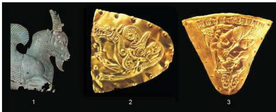
Obr. 3. Sedem Bratov, mohyla 4. 1 – rythón (Ag) ukončený hlavou okrídleného kozoroha – dĺžka 63 cm; 2 – trojuholníková platnička (Au) s vyobrazením fantastického živočícha. Výška 8,3 cm. 3 – trojuholníková platnička (Au) so scénou kozoroha napadnutého šelmou. Výška 9,8 cm. Podľa Artamonov 1966, tab. 119, 121, 122