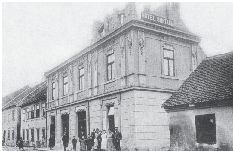
Obr. 5: Hotel Lea Smetany č. p. 885 v Uh. Brodě, kde se kontaktovali uprchlíci směřující na Slovensko. Foto 1905? (Soukromý archiv autorky textu)

Židovským rodinám se v prvních letech války odebíraly knihy a na 50 000 výtisků obsahujících duchovní dědictví Židů bylo nashromážděno právě ve Smetanově hotelu. Odtud je později odeslali do Frankfurtu nad Mohanem, kde se připravovalo budování protižidovského muzea. 50 Vedle uskladňování knih se rovněž ve stejném hotelu od počátku okupace soustřeďovali uprchlíci, kteří dále