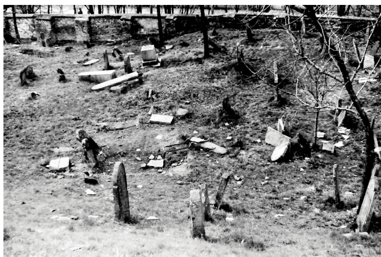
Obr. 7: Poničený starý židovský hřbitov v Uh. Brodě.