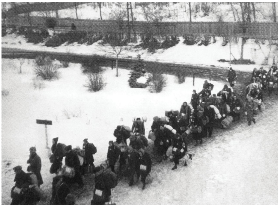
Obr. 8: Odchod Židů na nádraží v Uh. Brodě 27. 1. 1943.