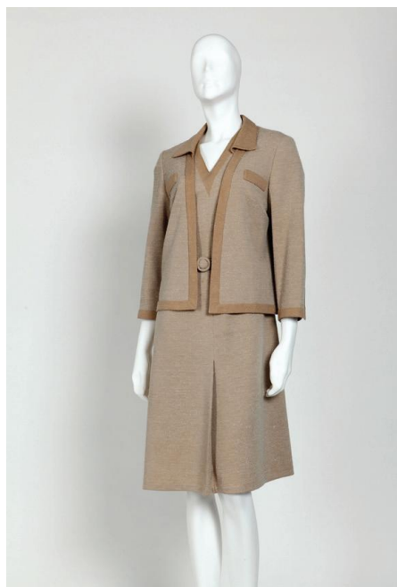
Obrázok č. 2: Vlasta Hegerová: dámske šaty navrhnuté pre vývojové centrum Módy , 70. roky.