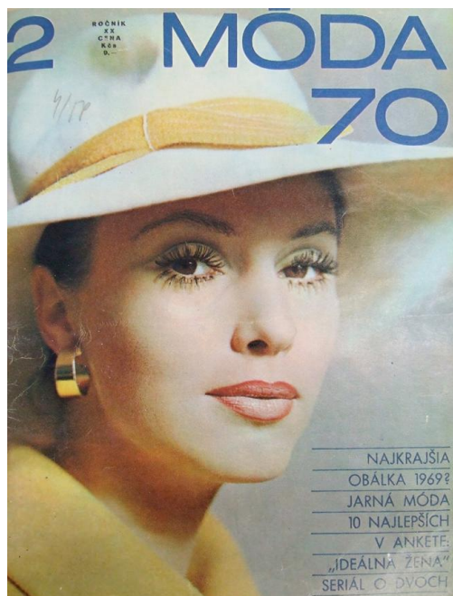
Obrázok č. 1: Obálka časopisu Móda , 1970.

Po revolúcii sa situácia v oblasti módnej žurnalistiky radikálne zmenila. Veľký hlad po západných módných trendoch spôsobil aj obrat v zacielení módných časopisov. Vzorom sa stala predovšetkým zahraničná móda a západné odevné značky. Počet strán časopisu Móda sa začiatkom deväťdesiatych rokov rapídne znížil a napokon v roku 1999 časopis definitívne zanikol.