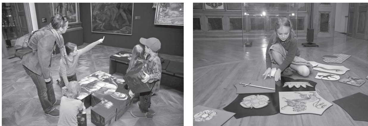
Obr. 1 a 2: Malí a velcí návštěvníci při hře s edukačními pomůckami ve stálé expozici Arcidiecézního muzea Olomouc.

Jiným druhem materiálních didaktických prostředků využitelných pro edukaci neorganizovaných skupin návštěvníků jsou textové pomůcky . Sem spadají např. tzv. samoobslužné pracovní listy . Oproti pracovním listům, jež využívá lektor při řízené edukaci, musejí být samoobslužné materiály opatřeny dostatečným textovým aparátem, který nahradí muzejního pedagoga při výkladu a následném zadávání úkolu. Dále by měl být výukový text opatřen klíčem k řešení jednotlivých úkolů a srozumitelně formulovaným slovníčkem důležitých pojmů.