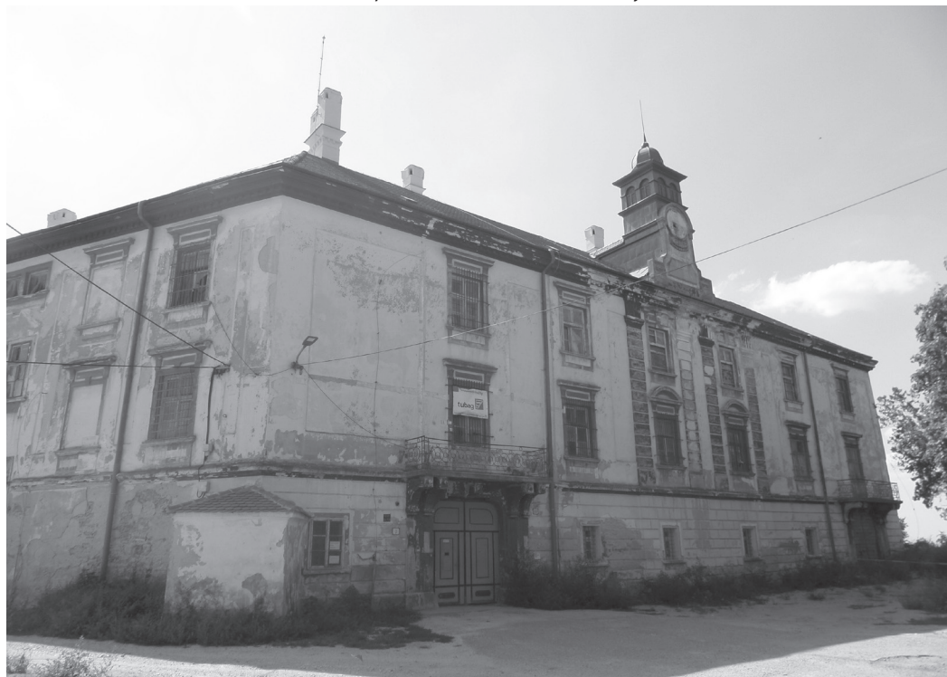
Obr. 6 Dnešná podoba zámku v Hlohovci