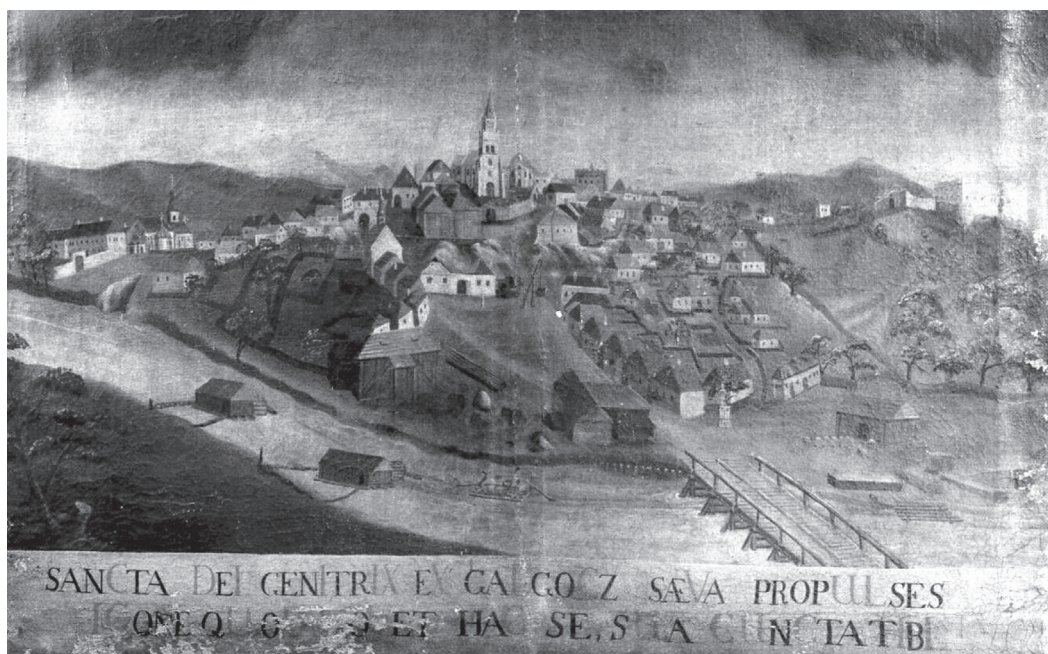
Obr. 2 Detail olejomalby Hlohovca z roku 1741, Mariologické múzeum v Bazilike Sedembolestnej Panny Márie v Šaštín-Stráže, s láskavým súhlasom p. Martina Lehončáka OSPPE, správcu farnosti Šaštín-Stráže