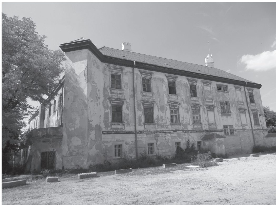
Obr. 5 Dnešná podoba zámku v Hlohovci, foto autor