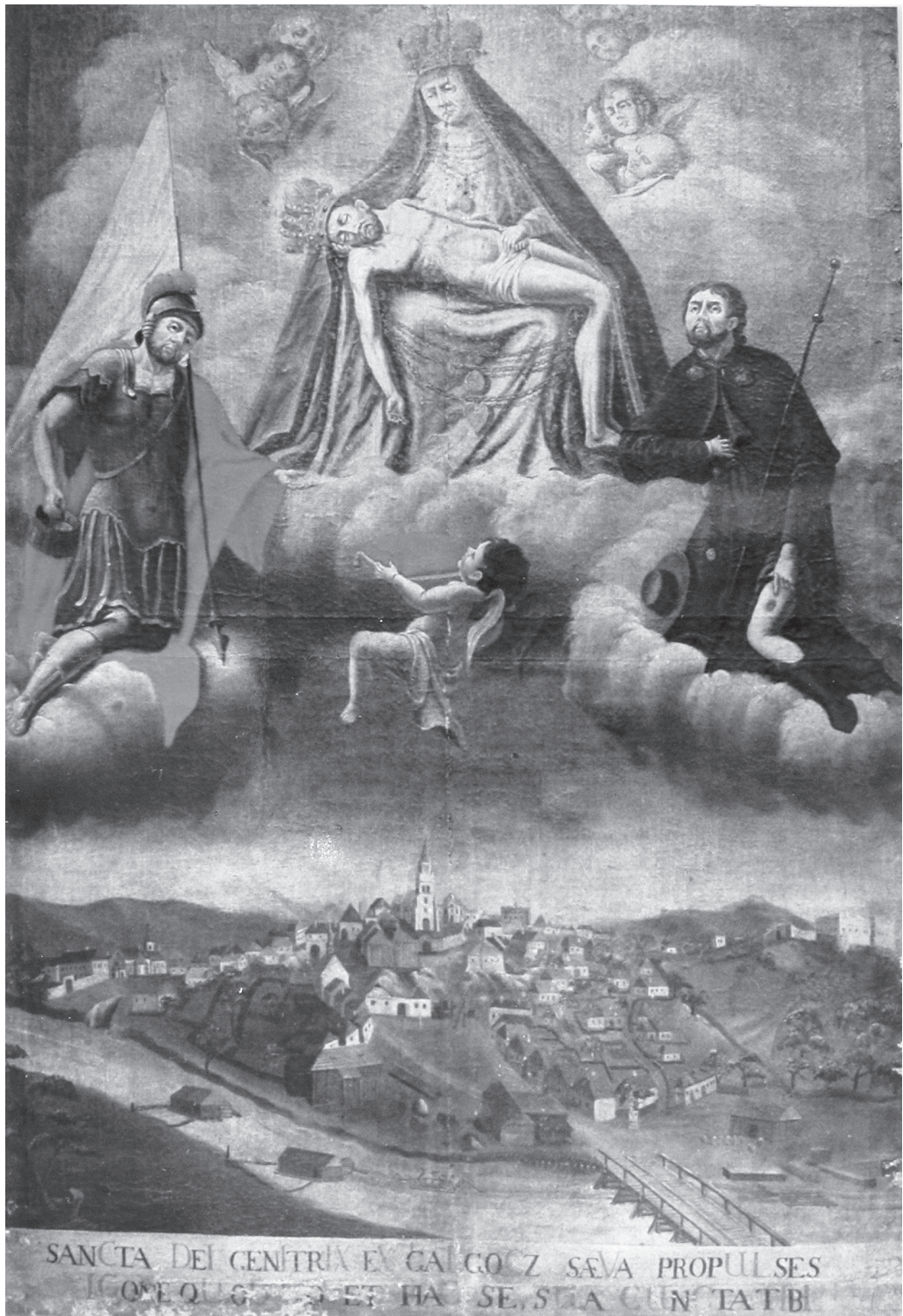
Obr. 1 Olejomaľba Hlohovca z roku 1741, Mariologické múzeum v Bazilike Sedembolestnej Panny Márie v Šaštín-Stráže